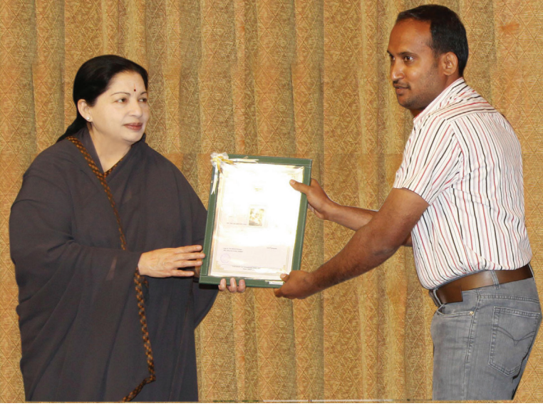
பணி நியமன ஆணை

நபர்களுக்கு ரூ.248.22 இலட்சம் மானியமாக வழங்கப்பட்டுள்ளது.