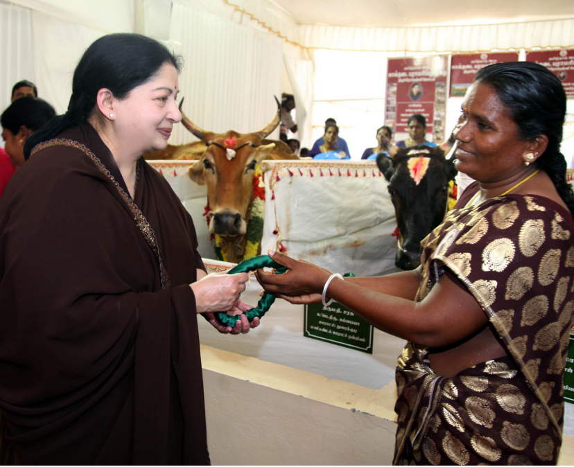
விலையில்லா கறவை மாடுகள் வழங்கும் திட்டம்