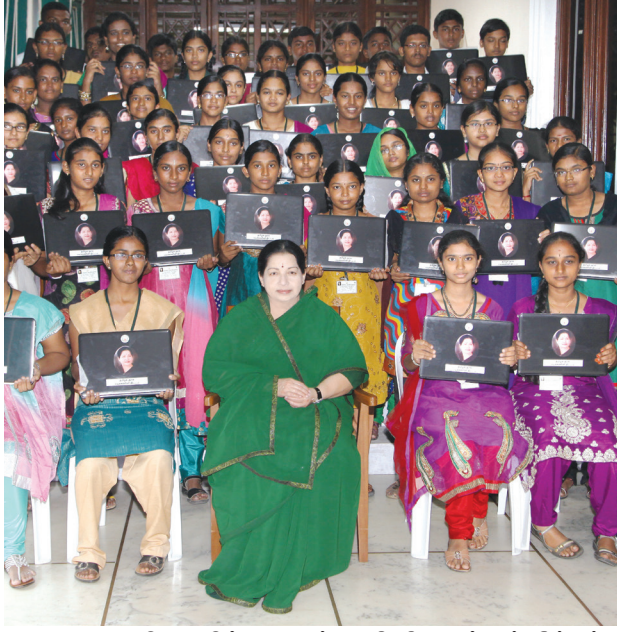
விலையில்லா மடிக்கணினி வழங்கும் திட்டம்