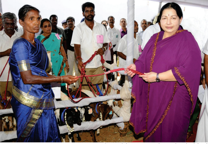
விலையில்லா ஆடுகள் வழங்கும் திட்டம்