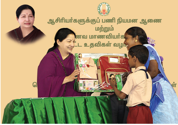
மாணவ, மாணவியர்களுக்கு விலையில்லா சீருடைகள், பாடப் புத்தகங்கள் மற்றும் குறிப்பேடுகள்

குழந்தைகளுக்கு கல்வி உதவித்தொகை ரூ.50,000 வழங்கும் திட்டத்தின் கீழ் 3 மாணவ, மாணவிகளுக்கு ரூ.1.50 இலட்சம் வழங்கப்பட்டுள்ளது.