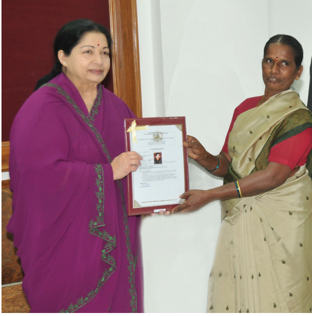
முதலமைச்சரின் விரிவான மருத்துவக் காப்பீட்டுத் திட்டம்