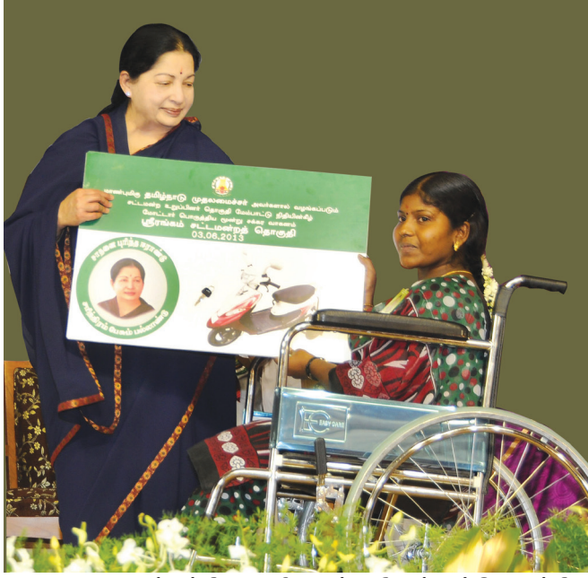
மாற்றுத்திறனாளிகளுக்கு மோட்டார் பொருத்திய மூன்று சக்கர வாகனம்