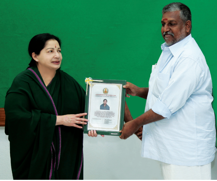
வேளாண் உற்பத்திக்கான விருது