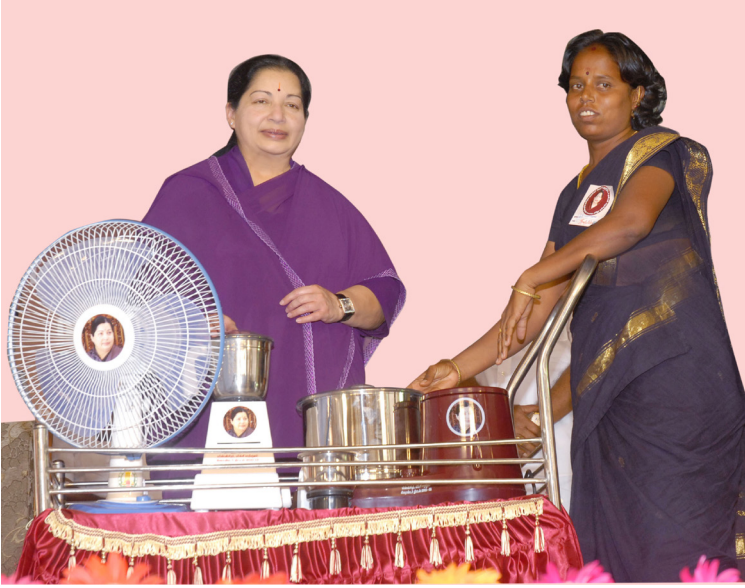
விலையில்லா மின்விசிறி, மிக்ஸி, கிரைண்டர் வழங்கும் திட்டம்