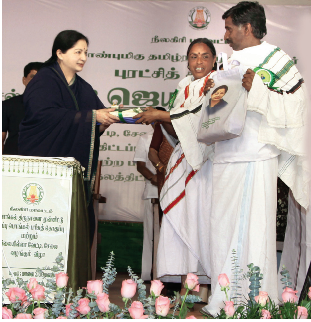
விலையில்லா வேட்டி, சேலை வழங்கும் திட்டம்

என பல்வேறு கடன் வழங்கப்பட்டுள்ளது. விவசாயிகள் தங்கள் விளைப்பொருட்களை சேமிக்க ஏதுவாக நபார்டு வங்கி நிதியுதவியுடன் தலா ரூ.8 இலட்சம், ரூ.11 இலட்சம் மற்றும் ரூ.27 இலட்சம் மதிப்பில் 34 ஊரகக் கிடங்குகள் ரூ. 3.44 கோடி மதிப்பில் கட்டப்பட்டுள்ளன.