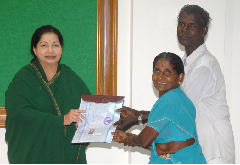
விரைவுப் பட்டா மாற்றம் வழங்கும் திட்டம்

இந்திரா காந்தி தேசிய விதவை ஓய்வூதியத் திட்டம்