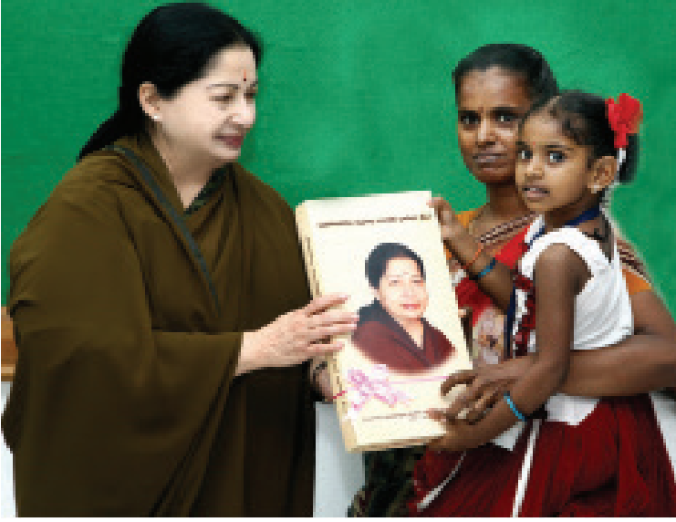
விலையில்லா வண்ண ஆடைகள் வழங்கும் திட்டம்