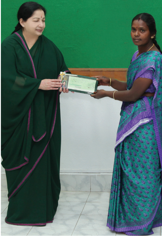
தாட்கோ மூலம் சுயஉதவிக்குழுக்களுக்கு பொருளாதார மேம்பாட்டிற்காக நிதியுதவி