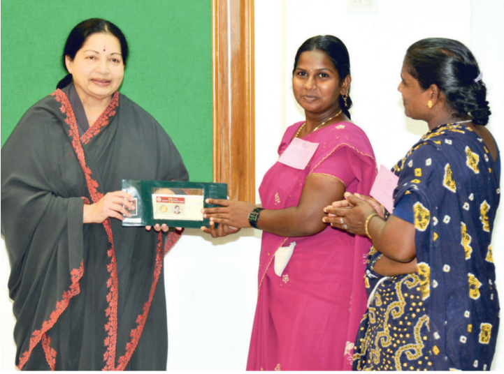
தாலிக்கு தங்கம் வழங்கும் திட்டம்