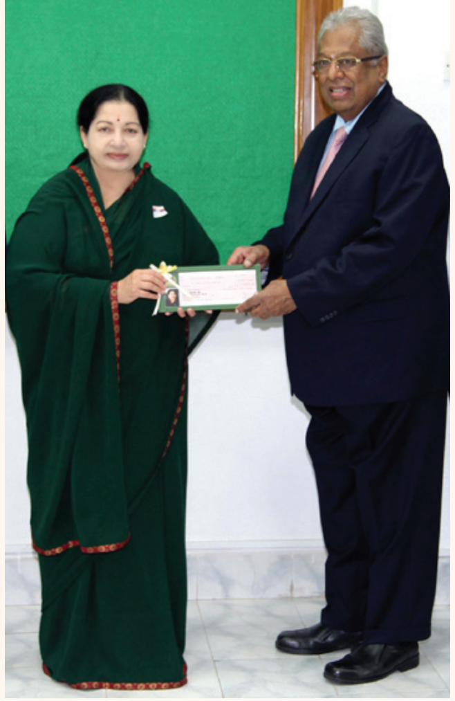
சென்னை ஓபன் டென்னிஸ் போட்டிகள் நடத்திட இரண்டு கோடி ரூபாய் வழங்குதல்