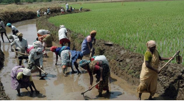
மகாத்மா காந்தி தேசிய ஊரக வேலை உறுதித் திட்டம்

நாடாளுமன்ற உறுப்பினர் உள்ளூர் வளர்ச்சித் திட்டம்