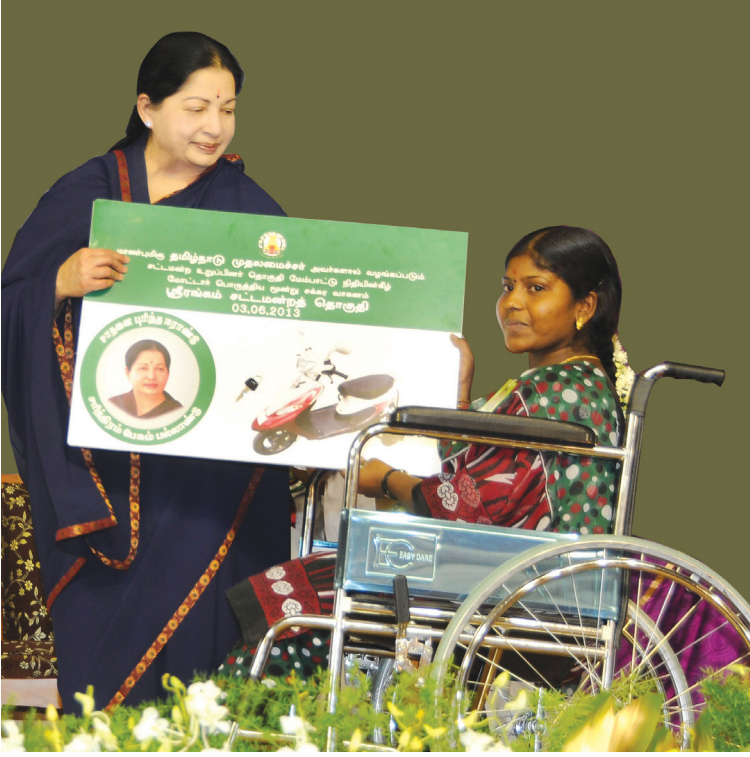
மாற்றுத்திறனாளிகளுக்கு மோட்டார் பொருத்திய மூன்று சக்கர வாகனம்