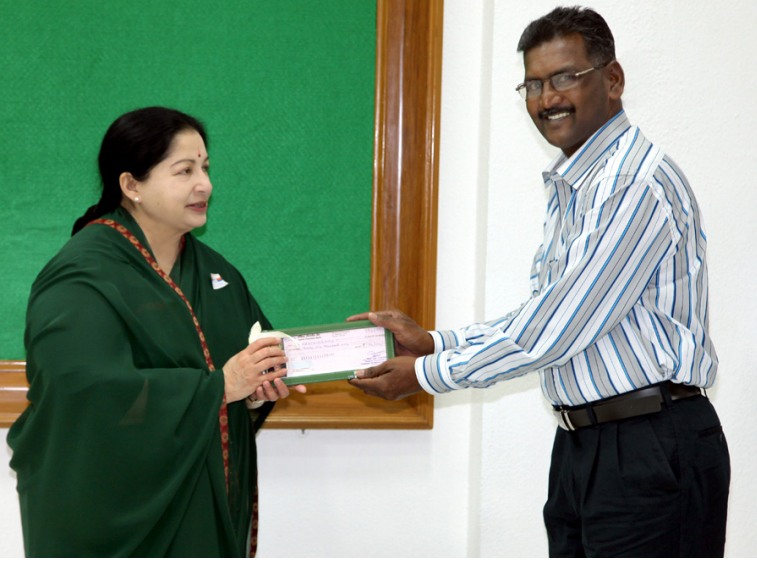
முன்னாள் படைவீரர்களின் குடும்ப நபர்களுக்கு கல்வி உதவித்தொகை