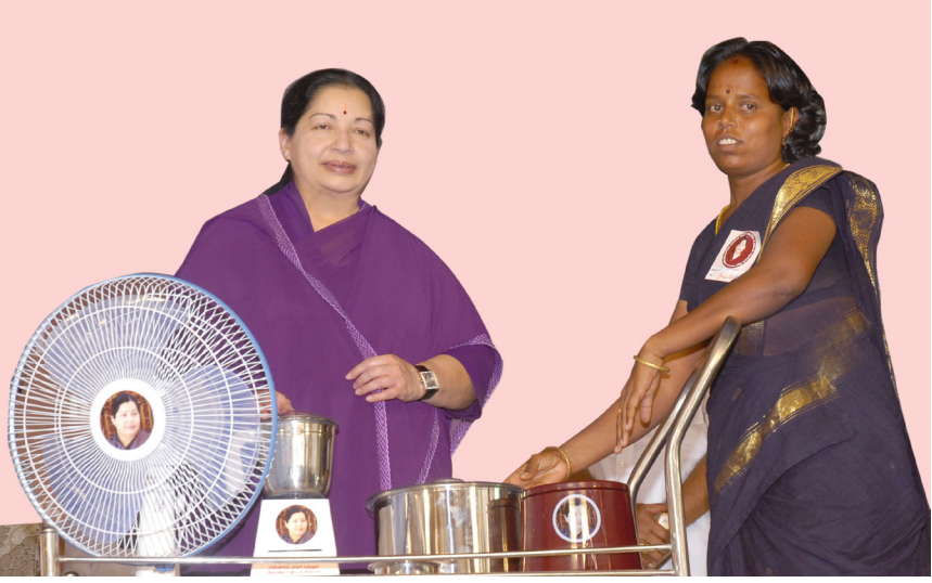
விலையில்லா மின்விசிறி, மிக்ஸி, கிரைண்டர் வழங்கும் திட்டம்