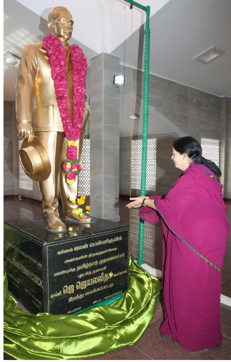
கர்னல் ஜான் பென்னிகுவிக் நினைவு மணிமண்டபம் திறப்பு

மாண்புமிகு தமிழக முதலமைச்சர் அவர்களால் திறந்து வைக்கப்பட்டது.