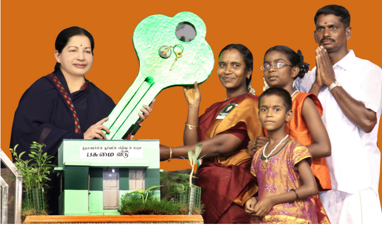
பசுமை வீடு திட்டம்