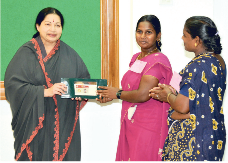
தாலிக்கு தங்கம் வழங்கும் திட்டம்