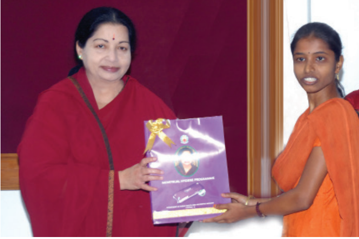
விலையில்லா நாப்கின் வழங்கும் திட்டம்

நபர்களுக்கு மார்க்பகப் புற்றுநோயும் கண்டறியப்பட்டு தொடர் சிகிச்சை அளிக்கப்பட்டு வருகிறது. பிறவி குறைபாடுடைய 662 ஆண், 628 பெண் குழந்தைகள் கணக்கெடுக்கப்பட்டு சிகிச்சை.