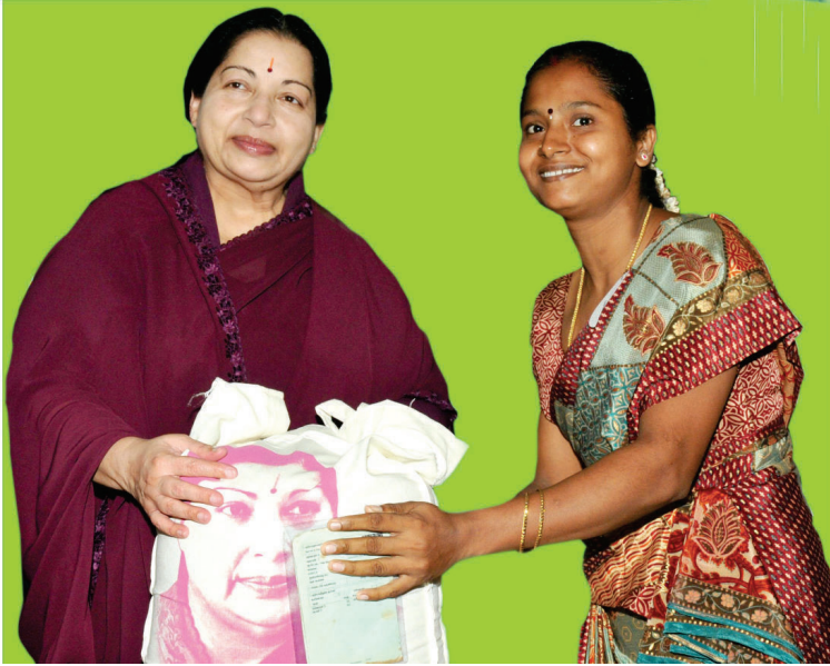
விலையில்லா அரிசி வழங்கும் திட்டம்