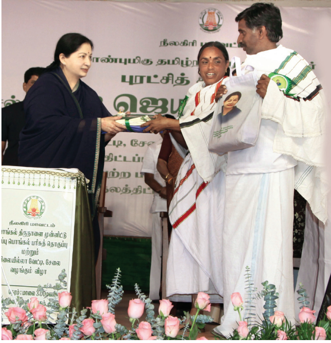
விலையில்லா வேட்டி, சேலை வழங்கும் திட்டம்

ரூ.438.76 இலட்சம் என கடன் வழங்கப்பட்டுள்ளது. விவசாயிகள் தங்கள் விளைப்பொருட்களை சேமிக்க 29 ஊரகக் கிடங்குகள் ரூ.316 இலட்சம் மதிப்பில் கட்டப்பட்டுள்ளது.