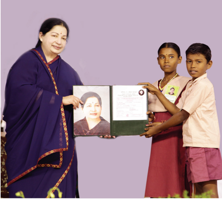
கல்வி உதவித் தொகை