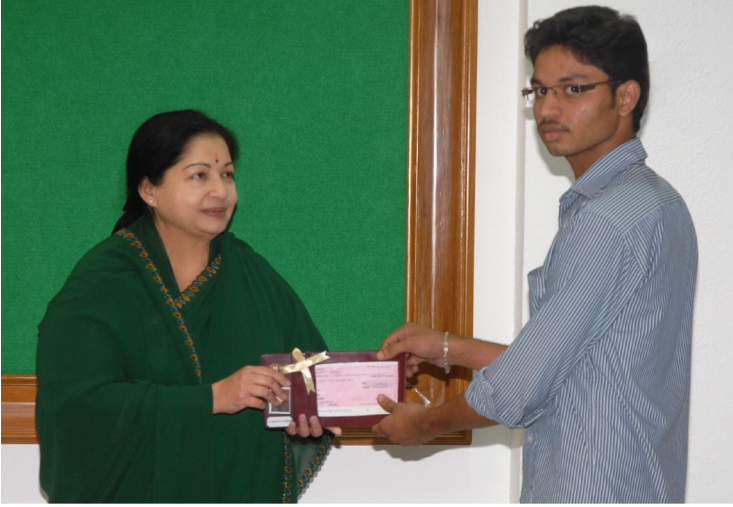
பட்டப்படிப்பு பயிலும் மாணவ, மாணவிகளுக்கு நிதியுதவி