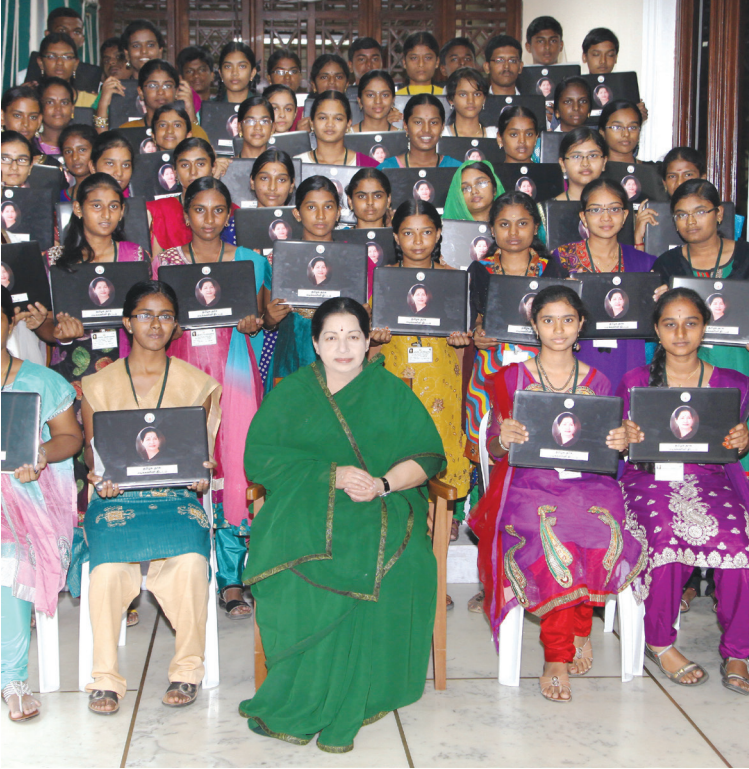
விலையில்லா மடிக்கணினி வழங்கும் திட்டம்