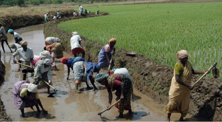
மகாத்மா காந்தி தேசிய ஊரக வேலை உறுதித் திட்டம்

❖ 5,67,207 குடும்பங்கள் 4,01,710 பதிவு செய்யப்பட்டு 5,42,996 தனிநபர்களுக்கு வேலை அடையாள அட்டை