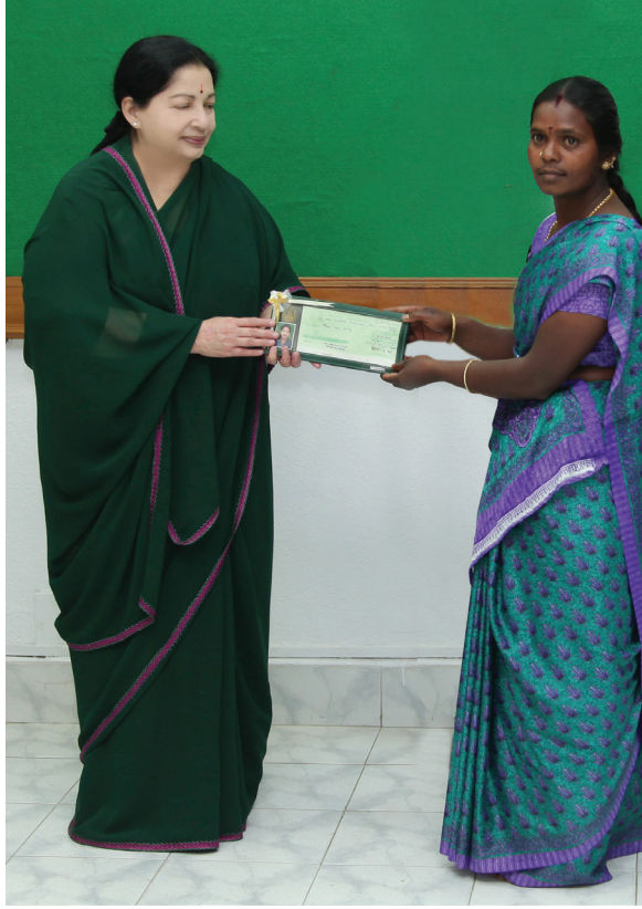
தாட்கோ மூலம் சுயஉதவிக்குழுக்களுக்கு பொருளாதார மேம்பாட்டிற்காக நிதியுதவி