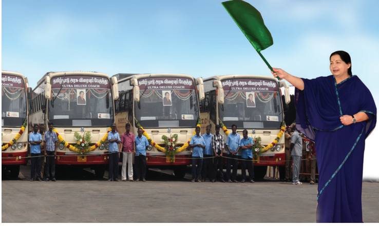
புதிய பேருந்துகள் துவக்கம்