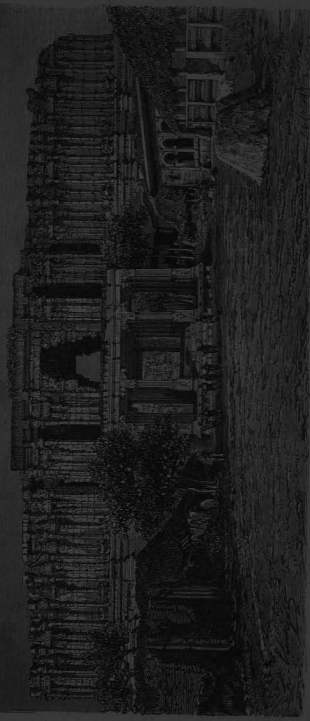
ROYAL GATE OF THE TEMPLE OF SERINGAM.