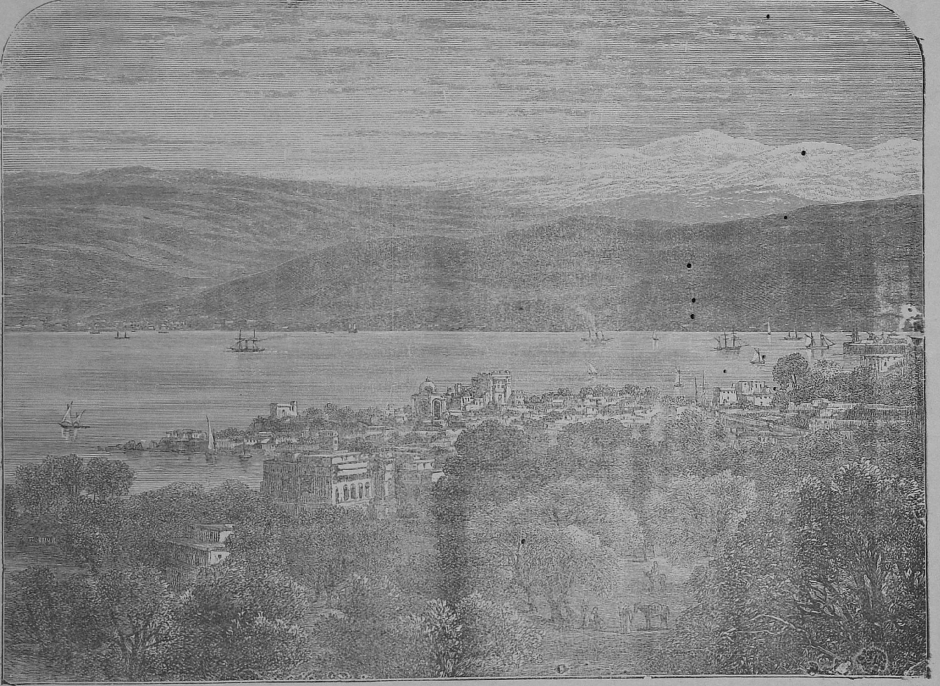
பெய்ரூட்டகாரமும் லீபனோன் மலையும்.

மட்டும் நான் உனக்காக ஜாமீன் ஏற்றுக்கொள்ளுகிறேன் என்று சொல்லி," அவன் கால் கைகளில் இருந்த விலங்கைக் கழற்றித் தன் கை கால்களில் போடும்படிச் சொல்லி அவனை அனுப்பிவிட்டார். காவற்காரர்கள் இந்தக் குருவை விலங்கிட்டு காவற்கிடங்கிற்கு அழைத்துக்கொண்டு போகிறார்கள். அதை ஜனங்களோ பார்த்து, ஐயோ, அந்தக் குற்றவாளிக்காக நீர் ஏற்றுக்கொண்டீரே, அவன் இனி திரும்பி வருவதெப்படி என்று அந்தக் குருவுக்காக அங்கலாய்த்துக்கொண்டும் போகிறார்கள். குற்றவாளி 10—நான் 10 மணிக்குள் வரவில்லையானால் குருவைத் தூக்கிவிடுவார்கள். ஆனால் அந்தக் குருவுக்கு விசனமில்லாமல் சந்தோஷமாக காவற்கிடங்கிற்கு வரவில்லை விலங்கிடப்பட்டவராகவருக்கிறார்.