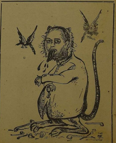
பேயு ஒலியும்... [அடுத்த பக்கம்]

அந்தப் புதிய அரசியல் சூட்சி மொழியாக இருக்கும்மாம்; ஆனால் பாராளுமன்ற உறுப்பினர்களில் சூட்சிலத்தோடு மலாய் மொழி, சீனமொழி, மற்றும் தமிழ் மொழியையும் கையாளவரும் என்றும் திட்டம் தந்திருக்கிறார்கள். மிகச் சிறப்பானமைவிராகை அங்கு தமிழர்கள் வசித்தப்போதிலும் மக்கள் கட்சியின் அந்த இனத்திற்குத் தந்திருக்கிற மத்ப்பண காம் வரவேற்கிறோம்! அதோடு விடுதலை பெற்ற நாட்டின் முதல், அமைச்சரவையின் வீற்றிருக்கிற இளைஞர்கள் அந்த நாட்டின் எதிர்கால ஏற்றத்திற்கு கல்லவை எண்ணற்றவை செய்ய வேண்டுமென்றும் வாழ்த்துகிறோம்!