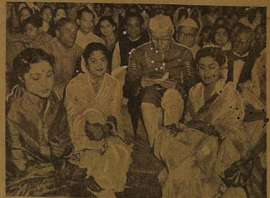
சினிமா நடிகைகளின் மத்தியிலே 'சினிமாக் கட்டுப்பாட்டு' தலைவரல்ல; பண்டித நேருதான்!