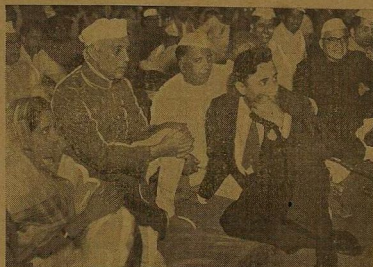
நேருவுக்குப் பக்கத்தில் நாகபுரி காங்கிரஸ் மேம்பட்டிருப்பது சூட்டோவல்ல; பிரபல கதாநாயகர் தேவ் ஆனந்த்!

நமது மாநிலத்தைத்தான் எடுத்துக் கொள்வோமே; பட உலக நிகழ்ச்சிகளிலே அதிகம் கலந்து கொள்வோர் யார்?