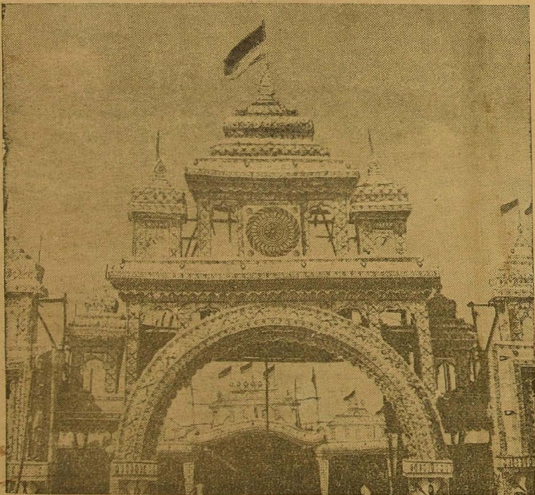
தருச்சி இந்தி எதிர்ப்பு மாநாட்டின் முகப்புத் தோற்றம்