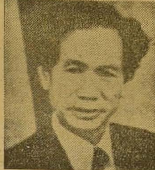
(நாகலாந்து, இந்தியர்வின் தீர்க்கப்படாத பெரிய பிரச்சினைகளில் ஒன்று. அதைத் தவி

சேரன் செங்குட்டுவன் அன்று வடபுலத்து மன்னர்களை, விவரம் தமிழ் மன்னர்