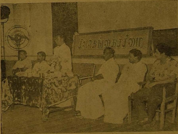
அறிஞர் அண்ணா அவர்கள் தலைமை வகித்துச் சொற்பொழிவாற்றுகிறார்கள்.

'பண்டைக் காலச் சரித்திரக் கதையைப் படமெடுப்பதில் கற்பனைக்கு நிறைய வாய்ப்பு உண்டு. ஆயினும் தமிழனுக்குப் பெருமை தரும் வகையில் சரித்திரச் சம்பவங்களைச் சித்தரிக்க வேண்டும். ஆராய்ச்சி நூல்களை நன்கு படித்து ஒப்பனைகளை நிறைவேற்ற வேண்டும். அறிவாற்றல் நிறைந்த கண்ணதாசன் தயாரிக்கும் இப்படம், நல்ல முறையில் வளர்ச்சி பெற்றுத் தமிழகத்துக்குப் பெருமையளிக்