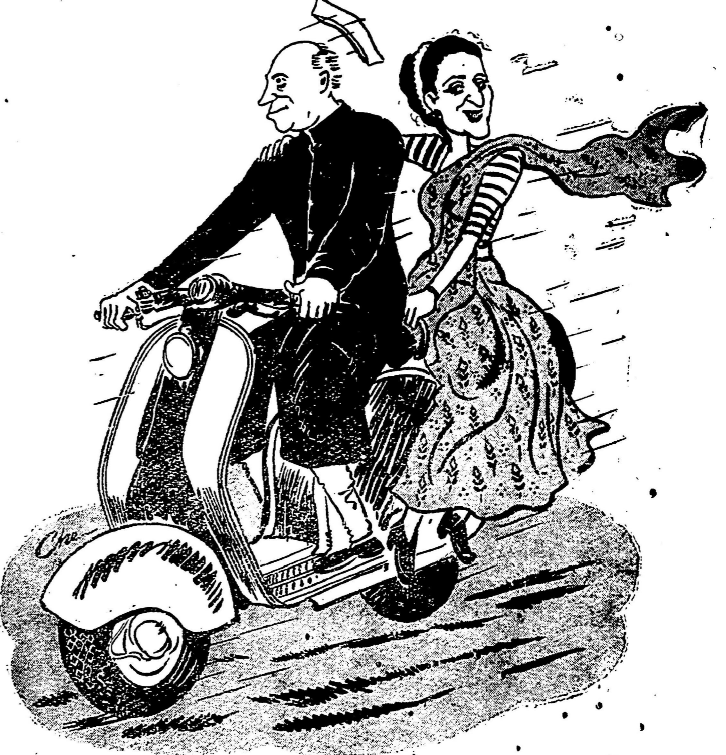
...நாடகத்தின் 'கிளைமேக்ஸ்' கட்டம்...