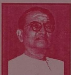
ம.ப.ரெயிசாயித் தரான் (ஐன.20)