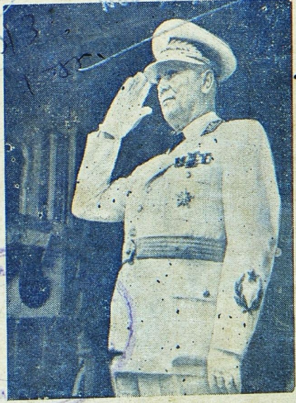
யூகஸ்லேவியா தலைவர் மார்ஷல் டிடோ