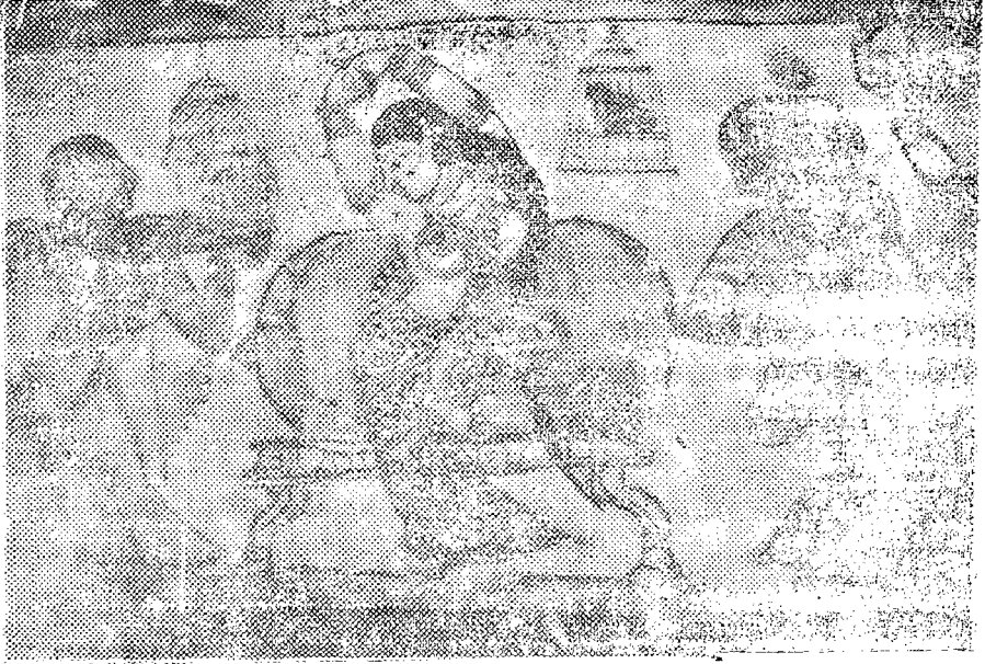
அரசி கண்ணாடிப் பார்த்து அலங்கரித்தல்

இவ்வோவியத்தில் பெண்களின் உருவங்களினாலேயே ஓர் யானையைப் போலவும் அதன்மீது அரசர் அமர்ந்து கரும்பு வில்லால் மலர்க்கணையினை அரசியை நோக்கித் தொடுப்பது போலவும், அதன் எதிரே பெண்களின் உருவங்களினாலேயே அமைந்த குதிரை உருவம் வரையப் பட்டு அதன் மீது அரசி அமர்ந்து அரசர் மீது மலர்க்கணை தொடுப்பது போலவும் உள்ள ஓவியம் எத்துணை முறை பார்த்தாலும் மீண்டும் பார்க்கத் தூண்டும் வண்ணம் அழகாக வரையப்பட்டுள்ளது.