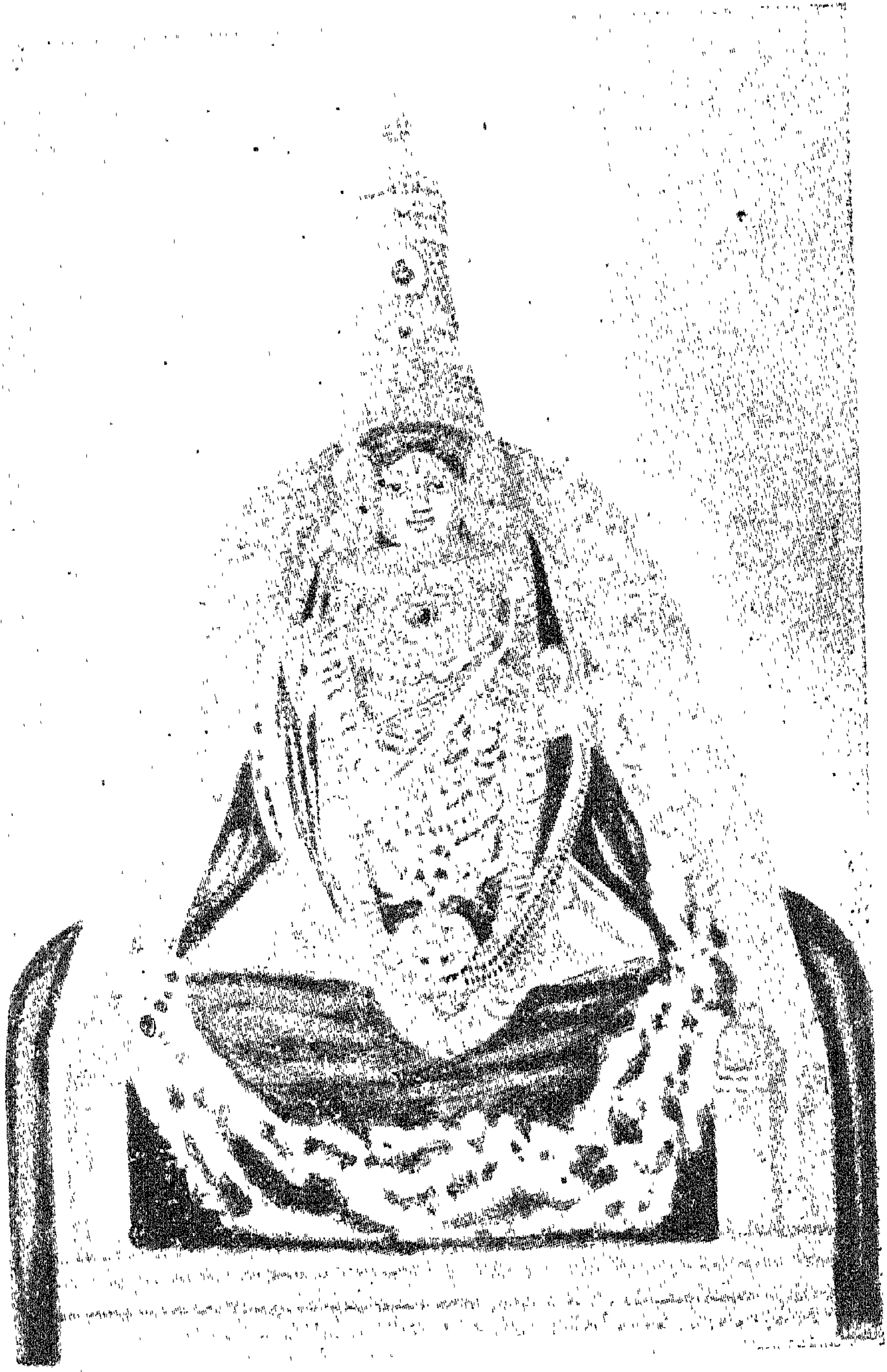
புரீமந் நிகமாந்த மஹா தேசிகன்