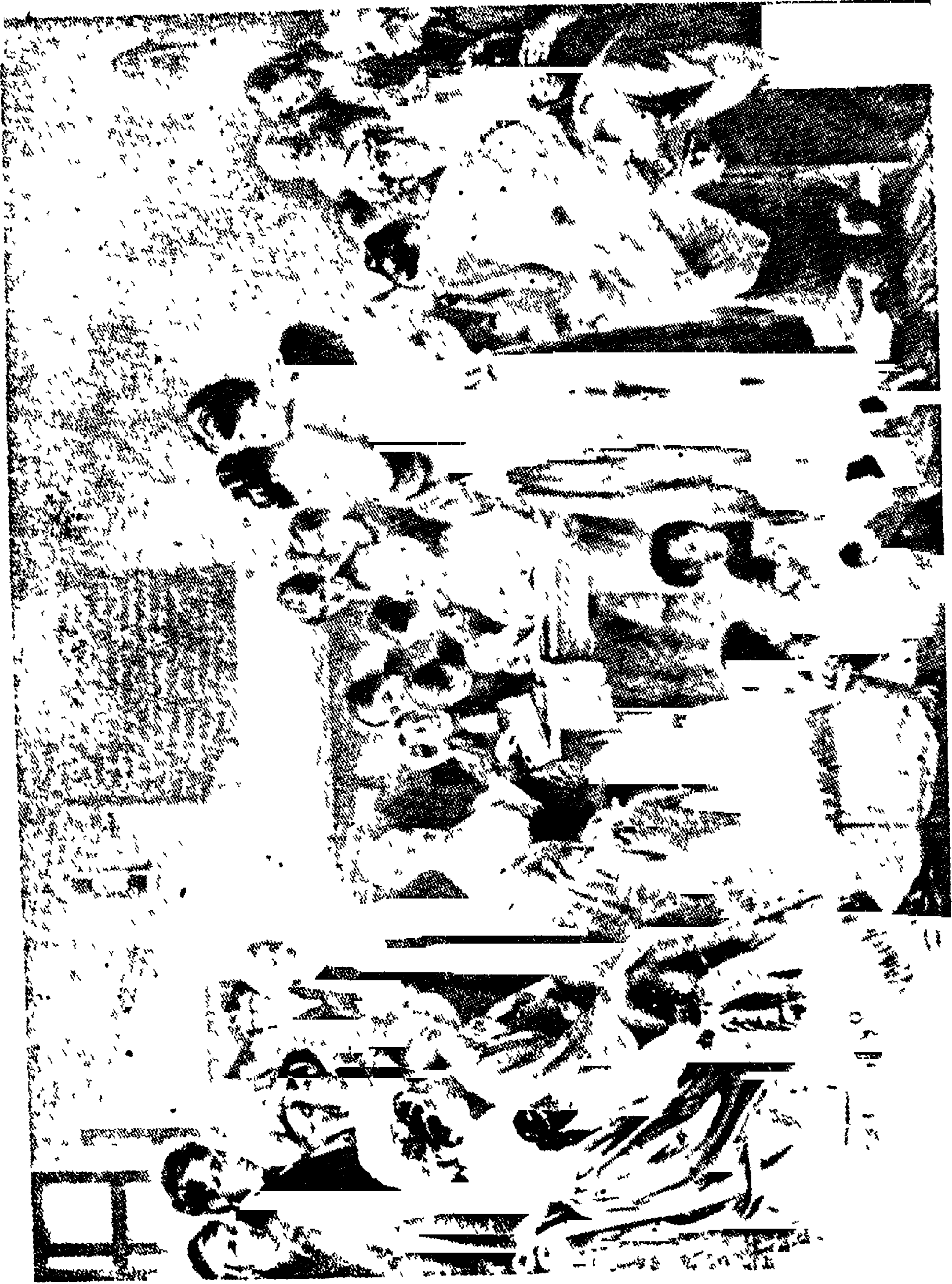
நியூகேட் சிறையில் க்விஸ்டர்ஸ் படித்தல்