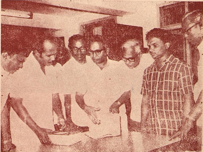
மாண்புமிகு வேளாண்மைத்துறை அமைச்சர் திரு. கா. காளிமுத்து எம்.ஏ., அவர்கள்