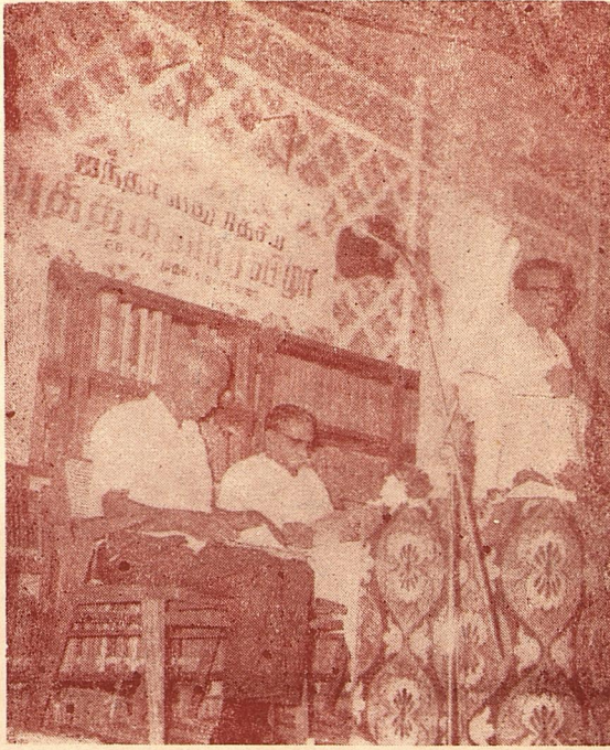
மாண்புமிகு நிதித்துறை அமைச்சர் திரு. இரா. நெடுஞ்செழியன், எம்.ஏ., அவர்கள்