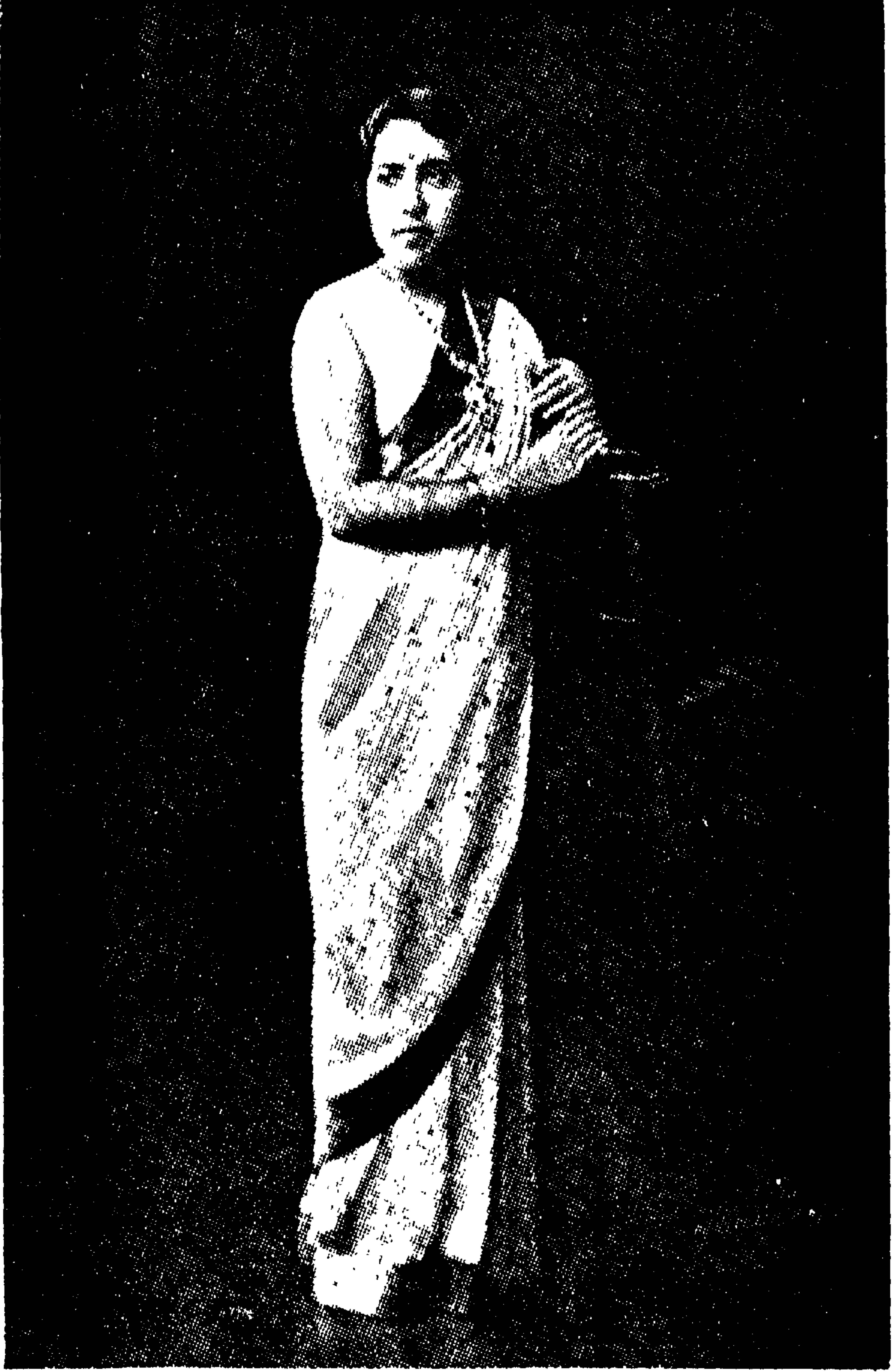
ஸ்ரீ சேதுபார்வதிபாய் மகாரணியார்