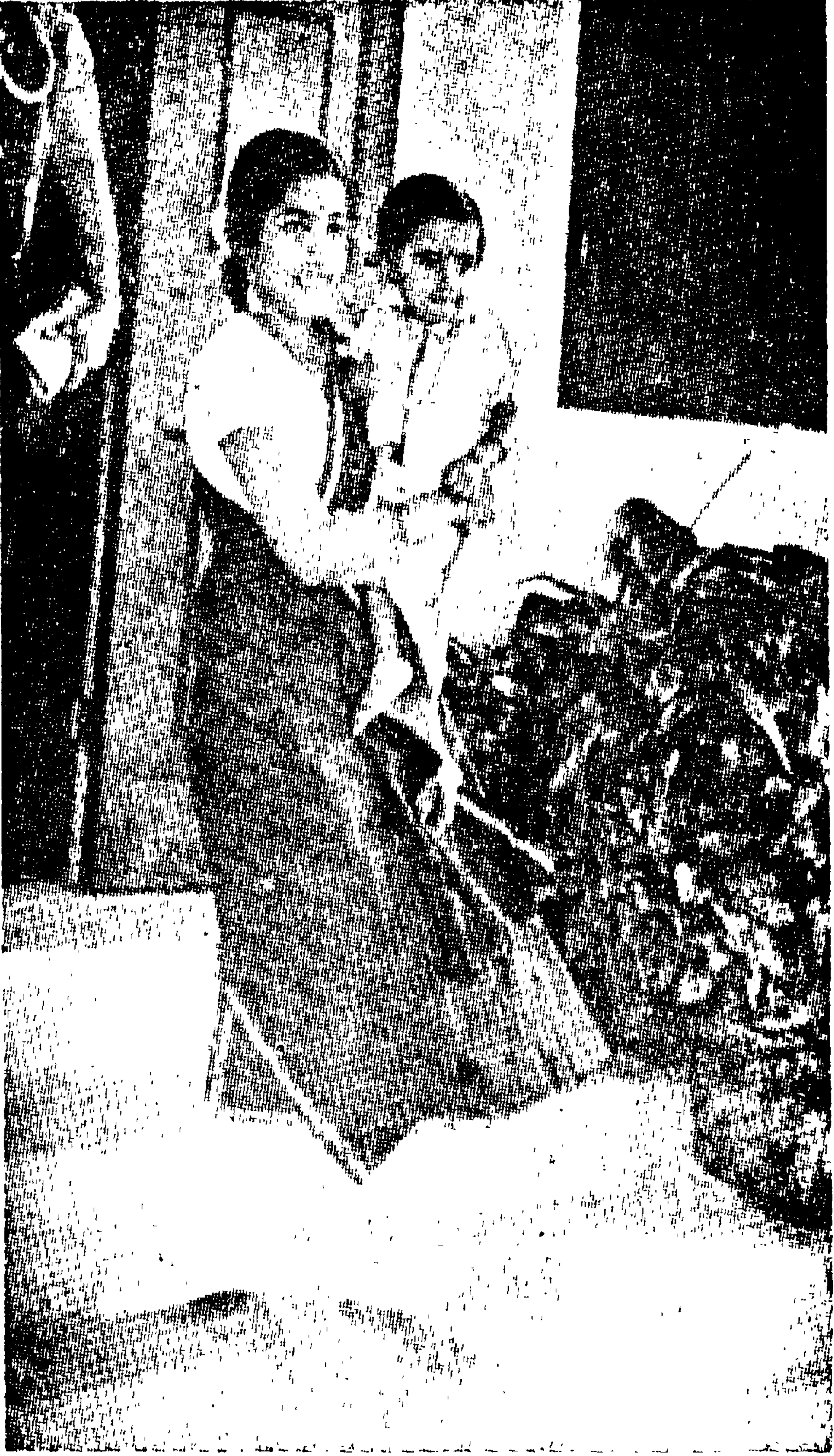
ஸ்ரீ கார்த்திகைத் திருநாள் இராணியாரும் அவிட்டம் திருநாள் அரசினங் குமாரும்