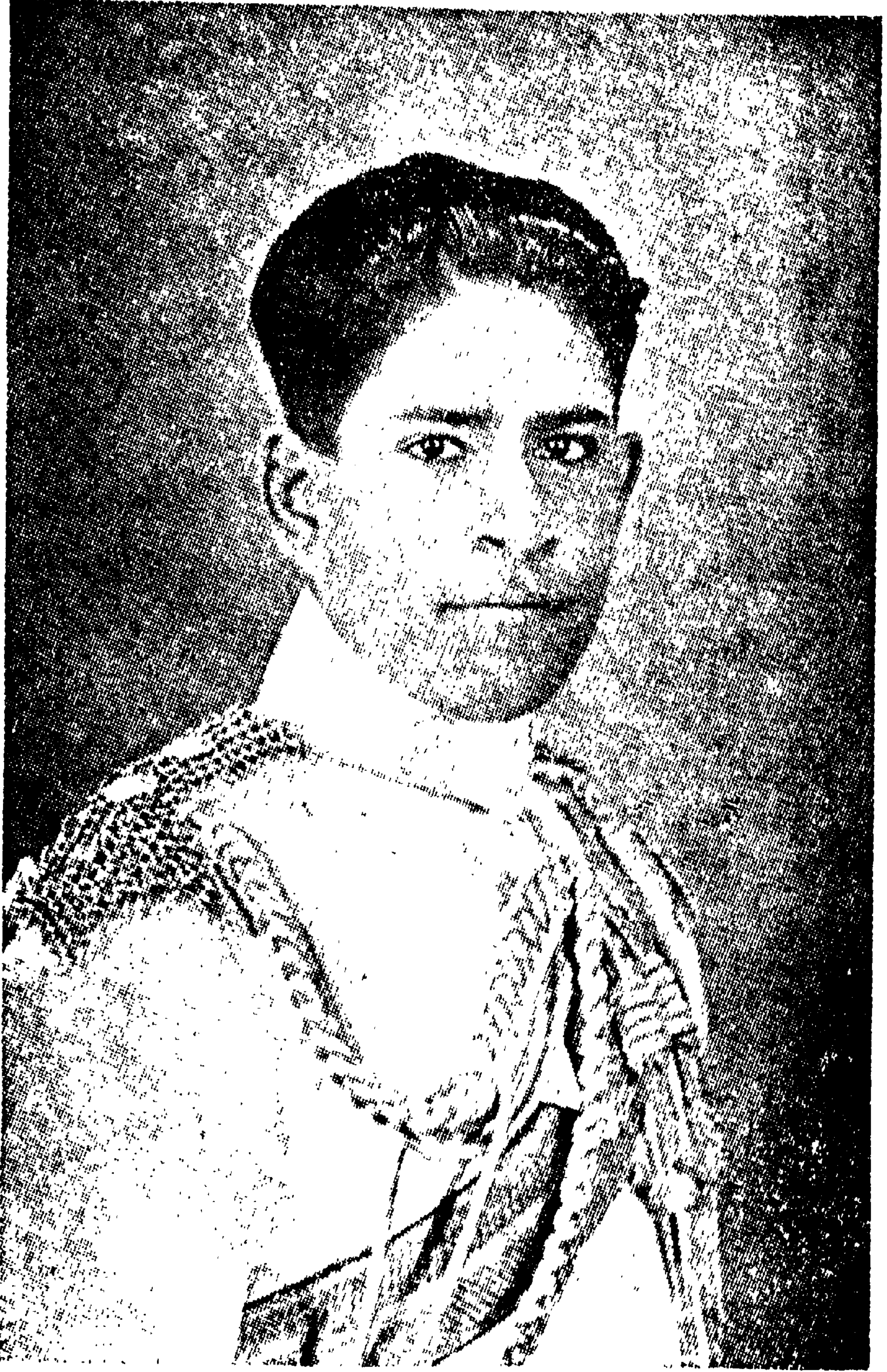
ஸ்ரீ மார்த்தாண்ட வர்ம இளைய ராஜா