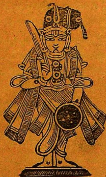
தேசிக்ரானுனகபதம் சிற்றப்பாசன்முன் வந்துசொல்லல்.