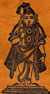
இராணி தேசிங்குராசனை கேட்கல்.

என்னையழைத்தகாரியமென்னெடுவிலே திரையென்ன இந்தப்பேச்சைக்காதில்கேட்டான்ராசாதேசிங்கு அந்தவேளையிலென்னசொல்லுகிறான்ராசாதேசிங்கு நாடுநாடுசேதிசொல்லுநிறைக்கெளந்தன்ராணியேநீ நவாப்புமேலேசண்டைக்குப்போகிறென்றதன்ராணியேநீ உனக்குச்சொல்லிப்போகவந்தேன்என்சன்ராணியேநீ அந்தப்பேச்சைக்காதில்கேட்டான்ராணியம்மாளும் என்னகாரியம்சொன்னீரையாள்தன்பிராணநாதா கோட்டைவெளியேபோகவேண்டாம்எந்தன்பிராணநாதா கோட்டையில்மெத்தபலமிருக்குதுஎந்தன்பிராணநாதா ஐந்துவருஷம்சண்டைசெய்யலாம்நமதுகோட்டைக்குள்ளே இந்தச்சேதிகாதில்கேட்டான்ராசாதேசிங்கு என்னபேச்சுபேசினாயடிஎந்தன்கண்மணியே பெண்புகுதிசண்டைக்கேற்குமாஎன்கன்பிராணநாயகி நானிப்போதேபோய்விட்டுவாரென்னன்பிராணநாயகியே இந்தப்பேச்சைக்காதில்கேட்டான்ராணியம்மாளும் என்னபேச்சுபேசினாயாளன்பிராணநாதா