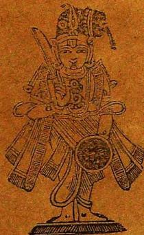
தேசிங்கு கோன்மமல்லன்து கோபித்தல்.