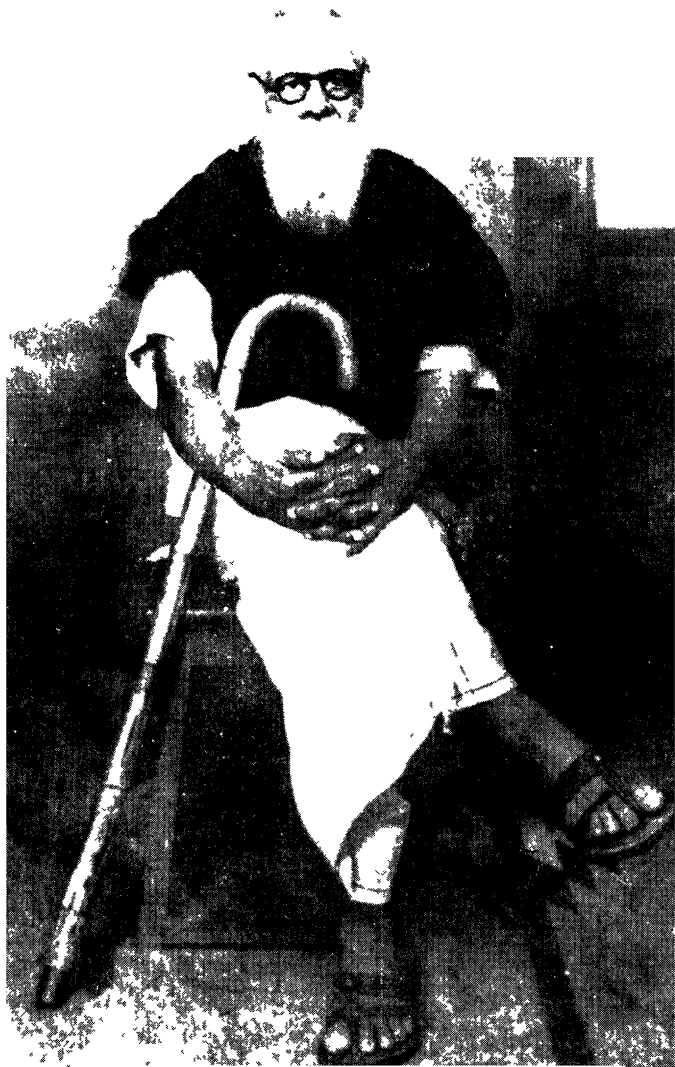
திரவிடத் தந்தை பெரியார். க. வே. இராமசாமி