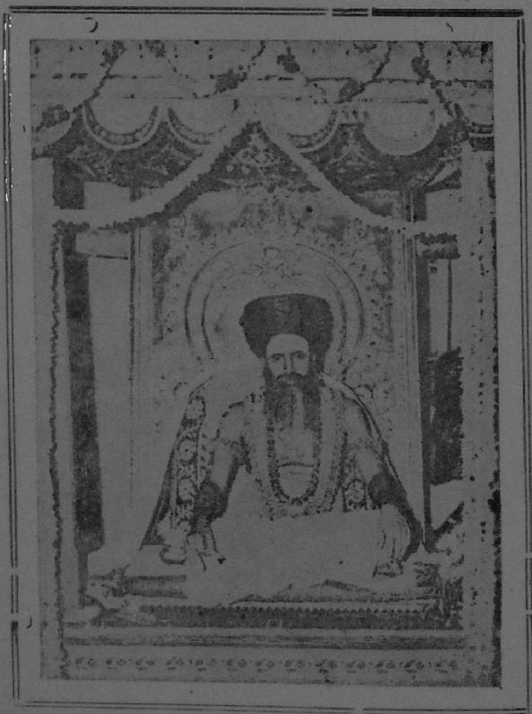
தருமையாதீனம் 28 ஆவது குருமகாசந்திதானம் ஸ்ரீலக்ஷ்மி சன்முகதேசிக ஞானசம்பந்த பரமாசாரிய கவாமிகள்