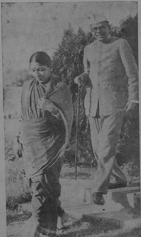
ஸிம்லாவில் சத்தியஸூர்த்தி தம்பதிகள்.