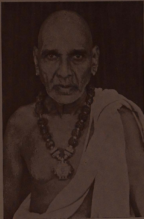
சிவபூர் ச. குமாரசுவாமிக் குருக்கள்.