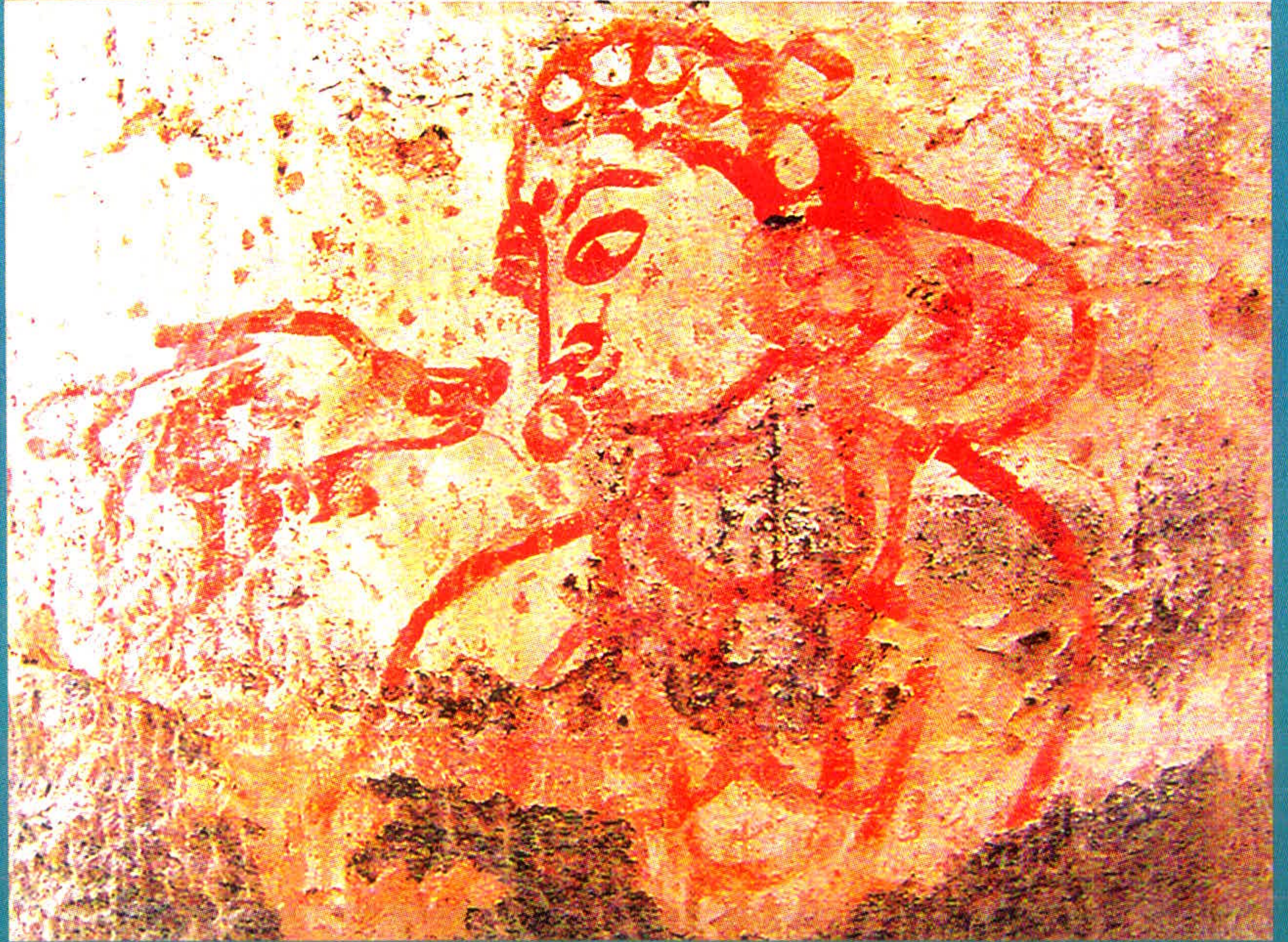
தமிழ்நாடு அரசு தொல்லியல் துறை சென்னை -600 008