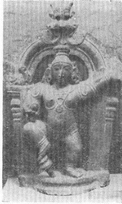
நவரீத கிருஷ்ணன் கி. பி. 18-ஆம் நூற்றாண்டு