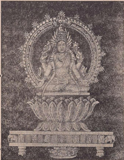
தங்கக்கமல வாகனக் காட்சி