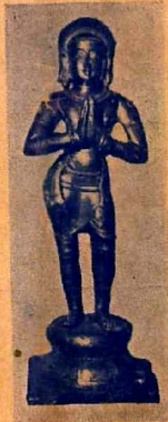
திருநாளைப்போவார் நாயனார் (நந்தனார்)