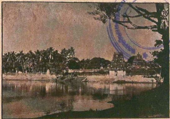
நந்தன் குளமும், மேலக்கோபுர வாயிலும்