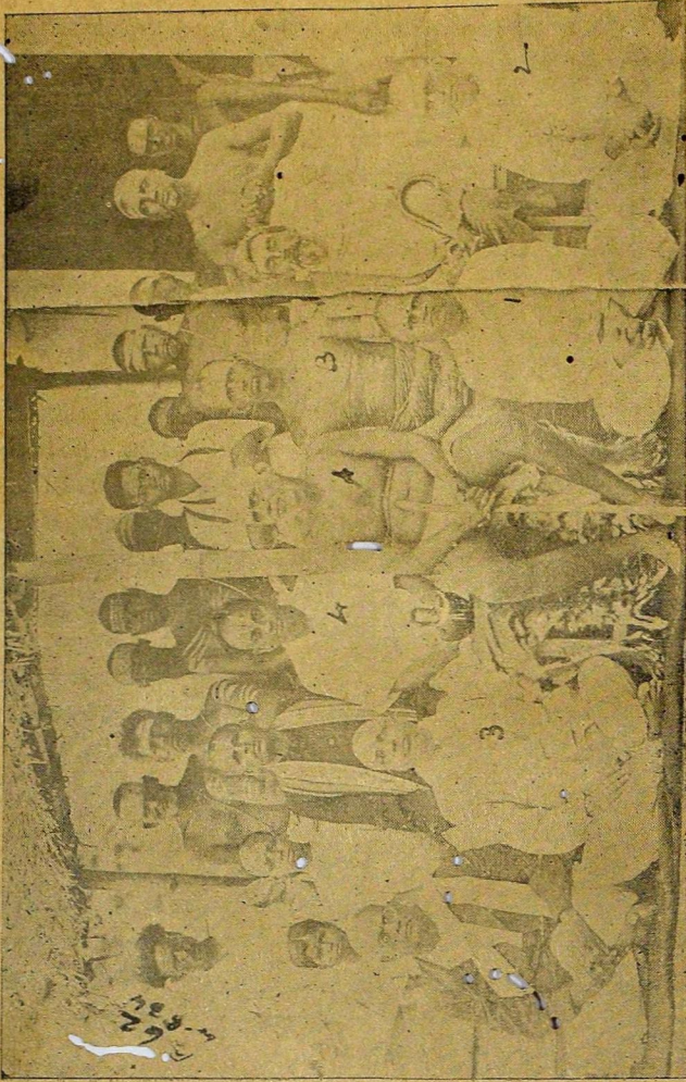
ரமணரிஷி, ரிஷியின் தம்பி தாசில்கார், டிப்டிகலக்டர், சம்மாஜிஸ்டிரேட், சர்க்கில் இன்ஸ்பெக்டர், வாட்டர் ஓர்க்ஸ் எஞ்சினீயர், வக்கீல்கள், முதலியவர்கள் சேர்ந்த படம்.