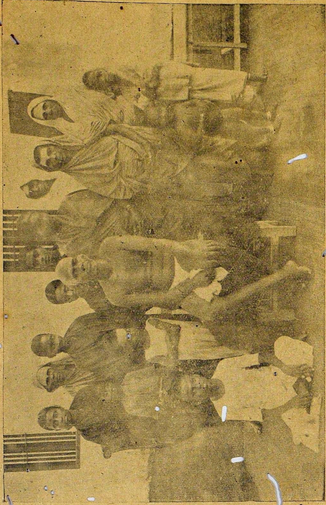
ரமணசிராமத்தில் வேலையை வெற்றிபெற நடத்திய ஸ்திரீகளும் சிஷ்யும்