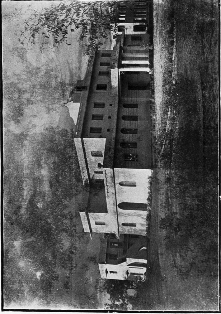
இசைக்கல் லூரி ( அண்ணாமலைப் பல்கலைக்கழகம் )