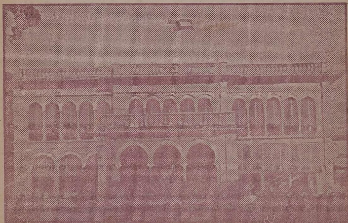
Front view of Tamil Nadu Archives