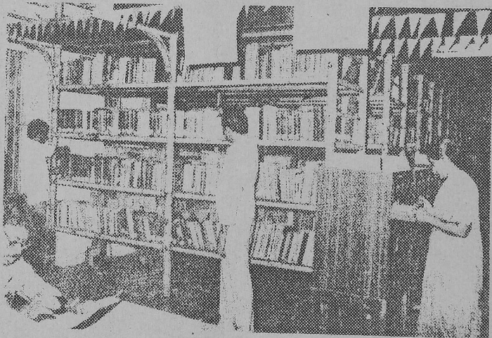
A View of Library

Bala Barata, Volume-1, 1907-1908 (4 issues) (edited by Poet Subramanya Bharathi).