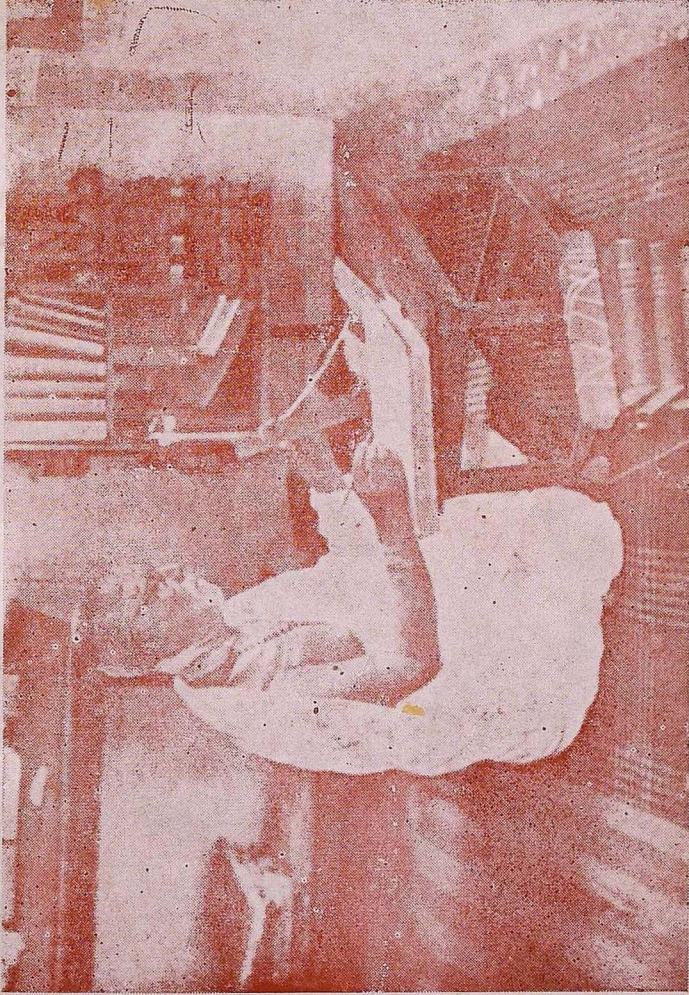
மகா மகோபாத்தாய டாக்டர் உ. வே. சாமிநாதையர்