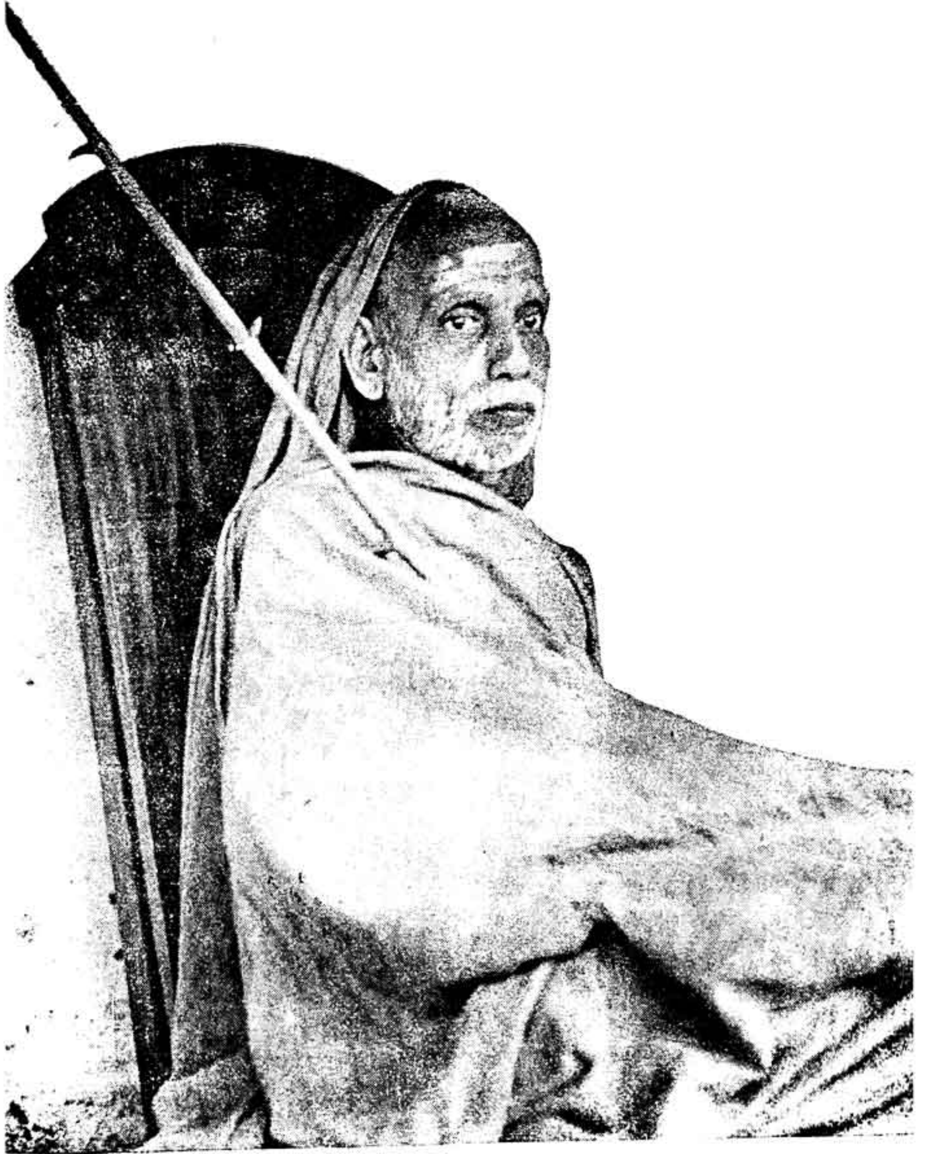
ஸ்ரீ சங்கராச்சாரிய சுவாமிகள் காஞ்சி காமகோடி பீடம்