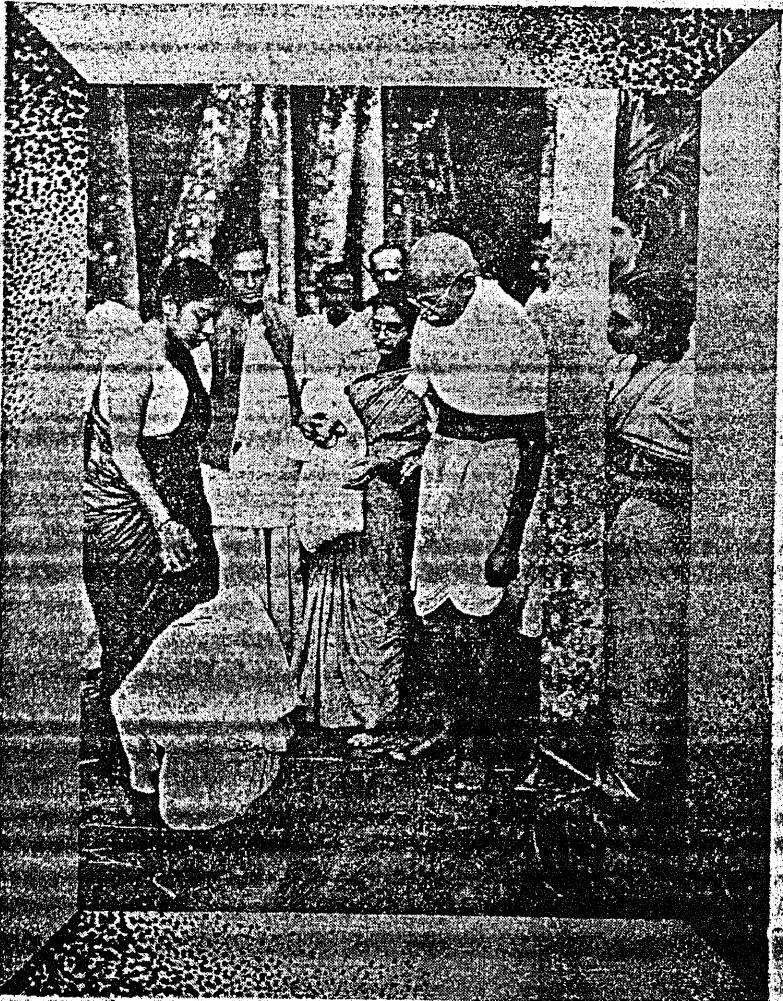
குதல்பட்டினத்தை அடைந்ததை அறிவிக்க வந்திருக்கிறார். இவருடன் சிலர் வந்திருக்கிறார்கள். இவர்கள் குதல்பட்டினத்தை அடைந்ததை அறிவிக்க வந்திருக்கிறார்கள்.