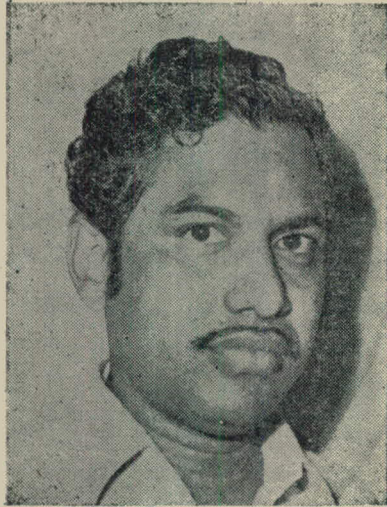
கவிஞர், நா. காமராசன்