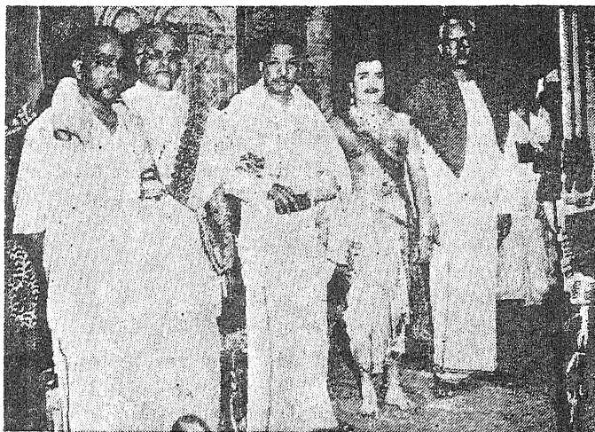
நாடக நண்பரோடு கலைஞரும், ஆசிரியரும்.