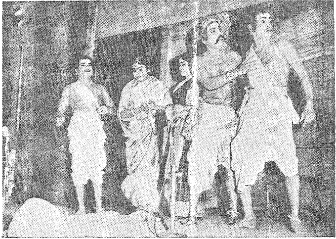
கூடிய குடும்பத்தோடு குன்றுடையான்.