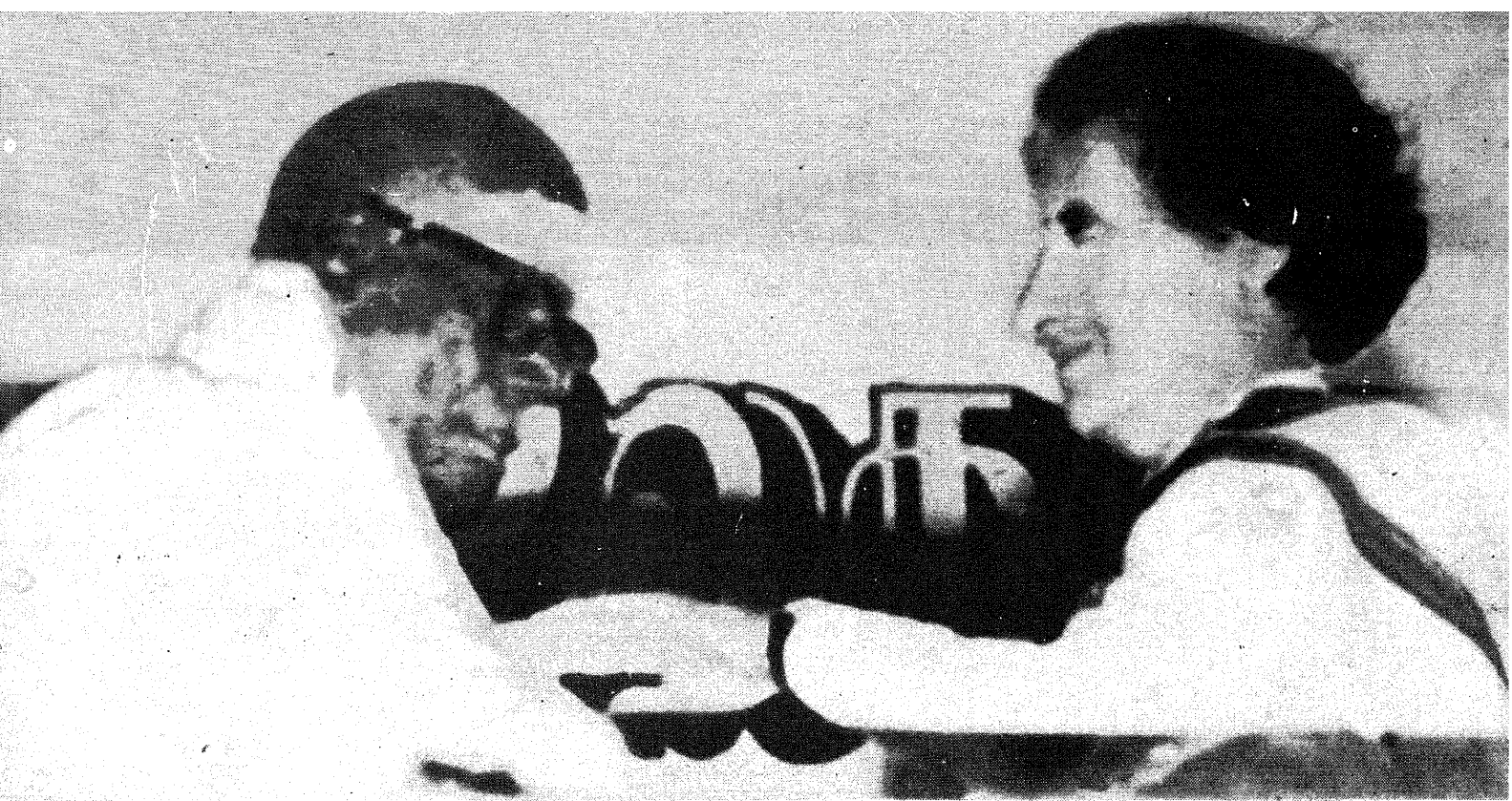
1981 - ஐந்தாம் உலகத் தமிழ் மாநாட்டில் பிரதமர் இந்திராகாந்தி ஒளவைக்கு விருது வழங்குதல்