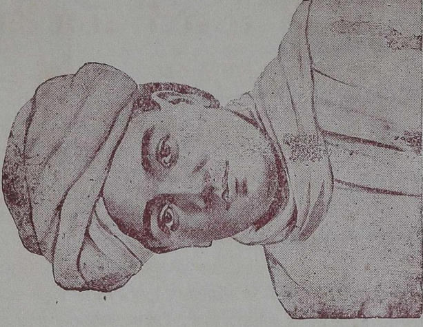
கவிமணி சி. தேசிகன் (செய்யுள் : பக்கம் 32)